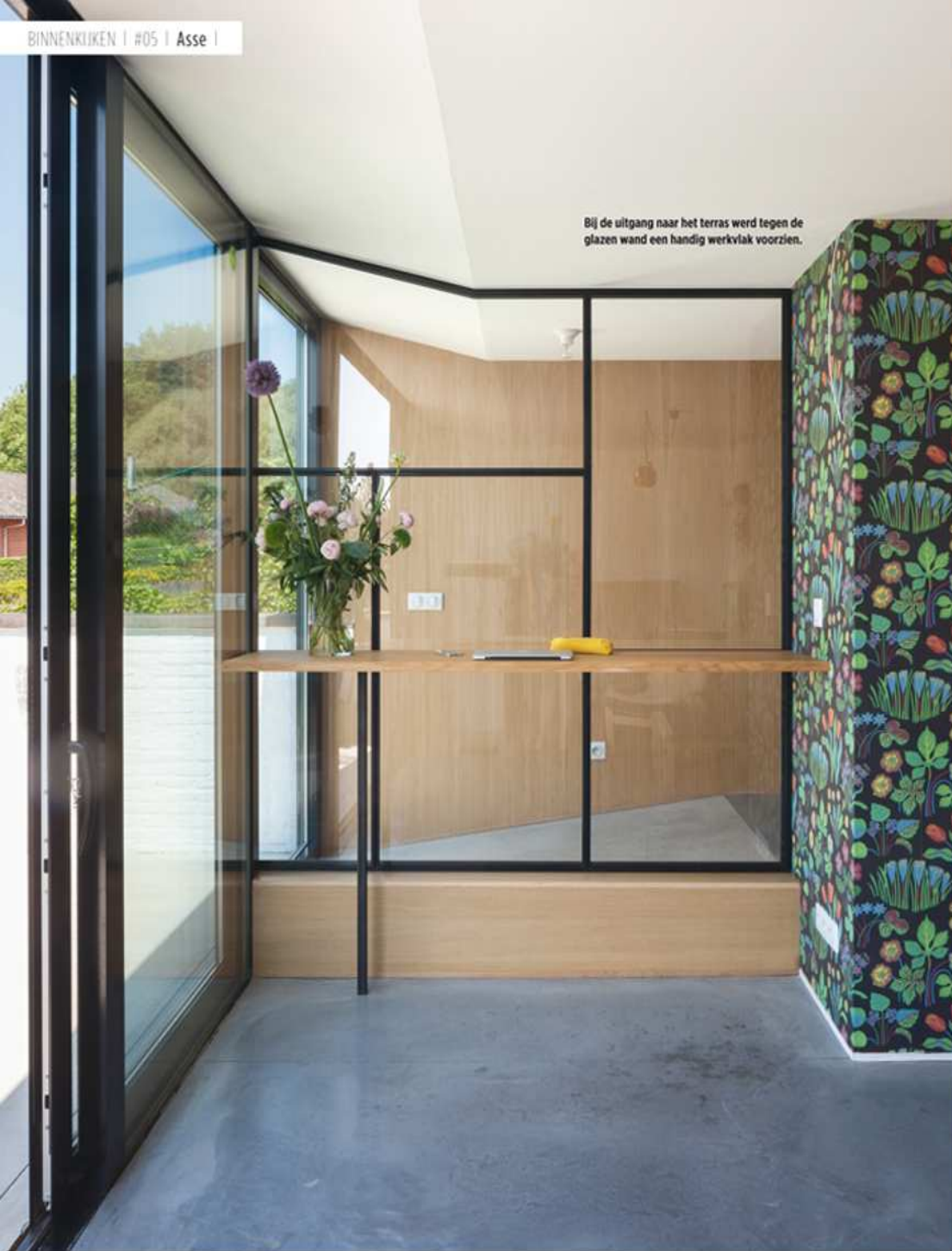
Bij de uitgang naar het terras werd tegen de glazen wand een handig werkvlak voorzien.

Vanop het terras - de tuin bevindt zich nog een niveau lager - is de met dakpannen beklede dakkapel goed te zien. Tuintafel en -stoelen van de kringloopwinkel. Bloembakken van Bacsac.