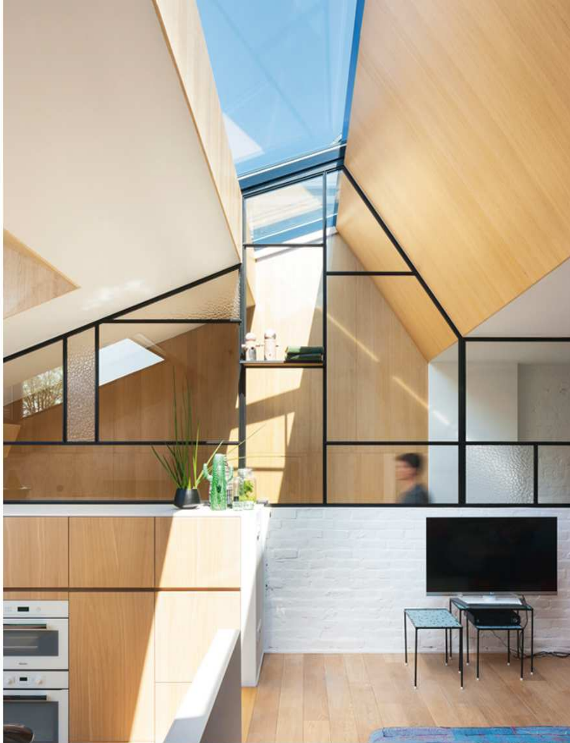
Op de grens tussen de keuken en de zithoek zorgt een lichtstraal voor bijkomende lichtinval. TV-tafeltjes van de kringloopwinkel.