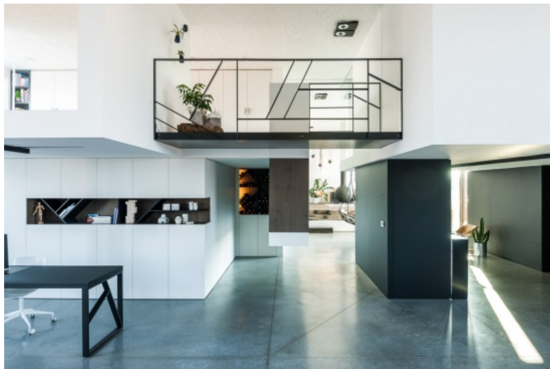
Met de totaalinrichting van deze loft nam Fierens Keuken en Interieur in 2017 deel aan de Schrijnwerk Awards