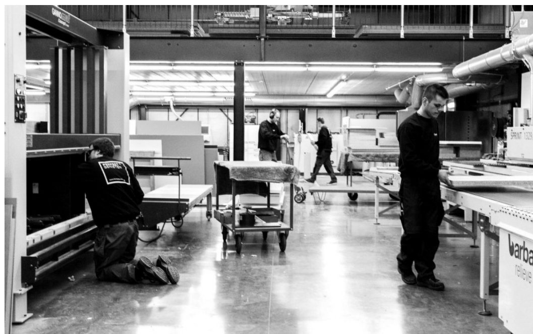
Elke werknemer in het atelier moet elke machine kunnen bedienen

"Het verschil tussen onze keukens en mainstreamkeukens is echt wel merkbaar. Onze kasten sluiten mooi aan op het plafond. We werken niet met brede tussenstukken. Ingebouwde ovens hebben slechts minimale voegen. De verstekken zijn van een uitzonderlijk hoog niveau. De graad van afwerking ligt veel hoger. Je voelt gewoon het vakmanschap. Daarnaast is ons aanbod quasi onbeperkt. Er staan mooie en inspirerende keukens in onze showroom, maar ons gamma is daar zeker niet toe beperkt, integendeel. Die toonzaalmodellen dienen enkel ter inspiratie van onze klanten. Ze zijn een vertrekpunt, geen eindpunt. Wil een bepaalde klant een geborsteld notelaarfineer, dan maken we die gewoon. We leggen absoluut de klemtoon op de maakbaarheid van het geheel. Net die unieke creaties maken het afwisselend en dus uitdagend voor zowel onze verkopers en ontwerpers als voor onze schrijnwerkers en plaat-sers."