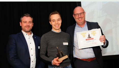
Foto: Kevin van Cortenberg (sponsor Leitz), Toon Ketelslaegers en Geert Schiffeleers (Schiffeleers Glas nv).

Voor de restauratie van het buitenschrijnwerk van een beschermd gebouw trok Schiffeleers Glas nv uit naar Schaarbeek. Vooral de restauratie van de erker zorgde voor heel wat uitdagingen. Zo werd het onderdeel volledig gedemonteerd en werd elk detail in het atelier nagemaakt tot in de perfectie.